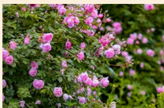
Die Rosenblüte hat begonnen – in den Gärten gibt es 2000 Rosenstöcke von 400 verschiedenen Sorten