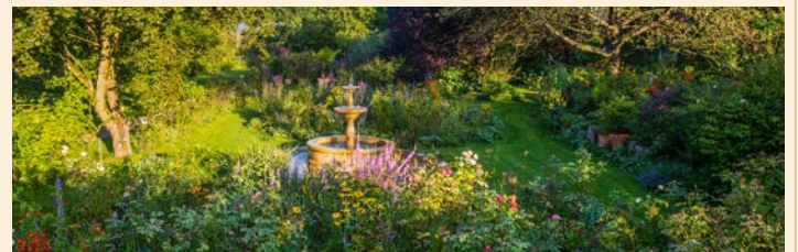
Im Rosengarten, einem der sieben Themengärten der Parkanlage am Michaelshof