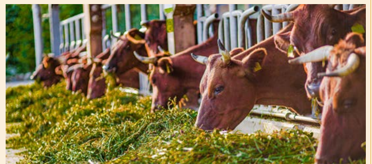
Angler Rotvieh, eine von vielen alten Haustierrassen, die auf dem Arche-Hof gehalten werden