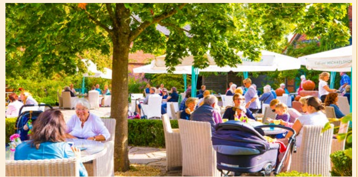
Ein großer Sommergarten vor dem Bio-Café ist wieder für Gäste geöffnet