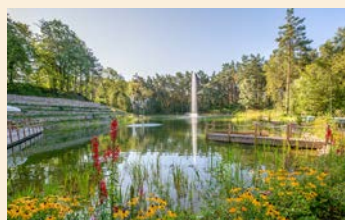
Der Sammatzer Waldsee, ein malerischer, von Rosenterrassen und Kiefernwald umrahmter See, ist Teil der Gärten am Michaelshof Sammatz